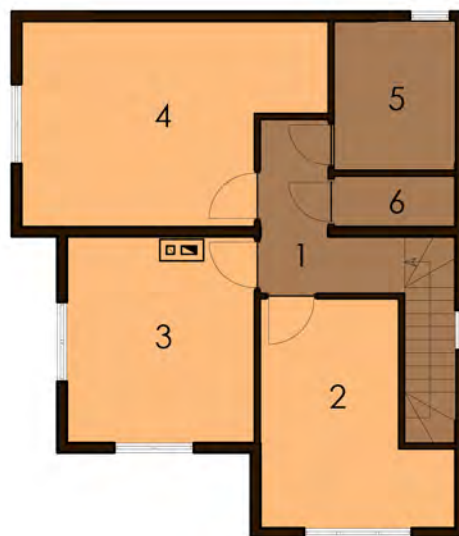
ПЛАН ДРУГОГО ПОВЕРХУ